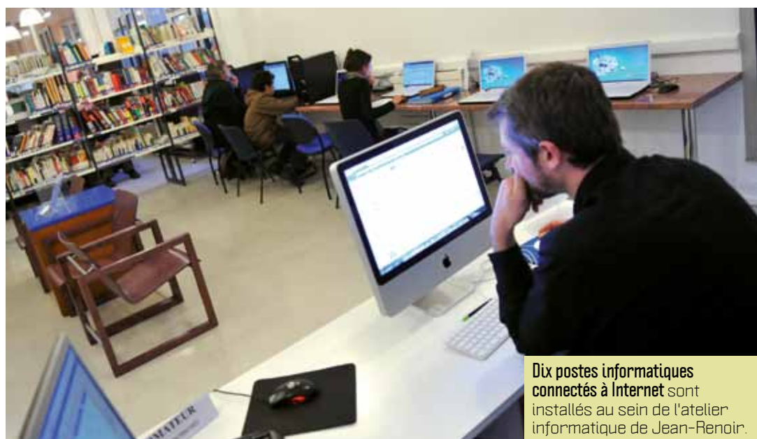
Dix postes informatiques connectés à Internet sont installés au sein de l'atelier informatique de Jean-Renoir.

les visiteurs souhaitant se connecter à Internet depuis leur propre ordinateur portable ou smartphone. Par ailleurs, le service "musicMe", qui propose l'accès à 6,6 millions de titres à écouter gratuitement en streaming et en toute légalité, fonctionne bien, avec près de deux cents comptes actifs et un taux d'écoute en progression constante depuis sa mise en service.