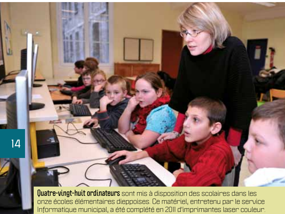
Quatre-vingt-huit ordinateurs sont mis à disposition des scolaires dans les onze écoles élémentaires dieppoises. Ce matériel, entretenu par le service Informatique municipal, a été complété en 2011 d'imprimantes laser couleur.

EN PRATIQUE : sur demande, les animateurs des ateliers multimédia peuvent dispenser aux parents d'élèves une formation à l'ENT. De plus, les familles qui n'ont pas Internet chez eux peuvent aussi se connecter au réseau @rsène 76 lors des plages horaires en accès libre des ateliers.