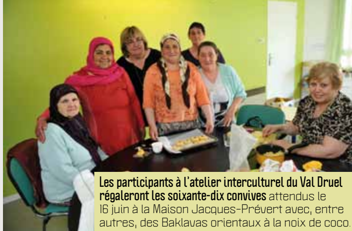
Les participants à l'atelier interculturel du Val Druel régaleront les soixante-dix convives attendus le 16 juin à la Maison Jacques-Prévert avec, entre autres, des Baklavas orientaux à la noix de coco.