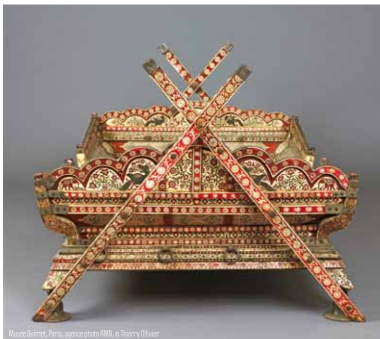
Musée Guimet, Paris, agence photo RMN, © Thierry Ollivier

À partir du 16 juin, le Château-musée de Dieppe présentera une collection d'ivoires issue du Musée national des arts asiatiques - Guimet.