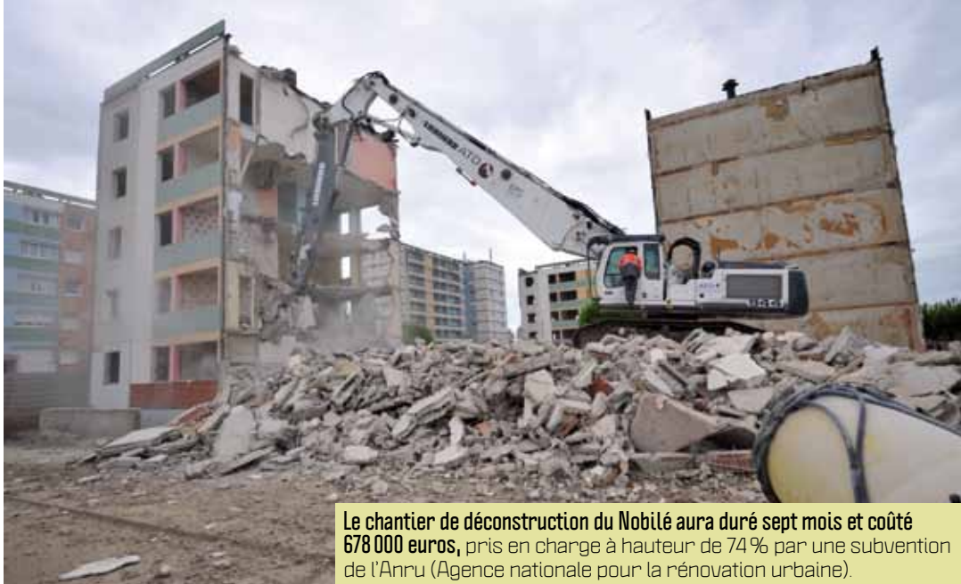
Le chantier de déconstruction du Nobilé aura duré sept mois et coûté 678 000 euros, pris en charge à hauteur de 74 % par une subvention de l'Anru (Agence nationale pour la rénovation urbaine).