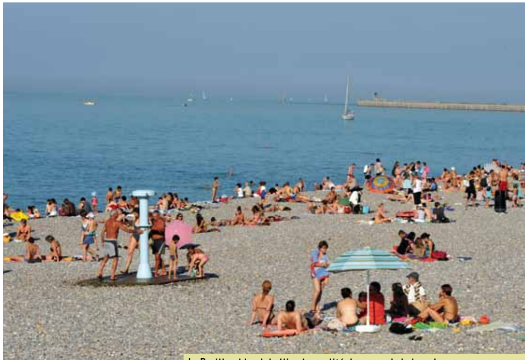
Le Pavillon bleu labellise la qualité des eaux de baignade, mais aussi la propreté des plages, leur accessibilité et les services proposés.

Label touristique national, le Pavillon bleu est gage de qualité pour les habitants.